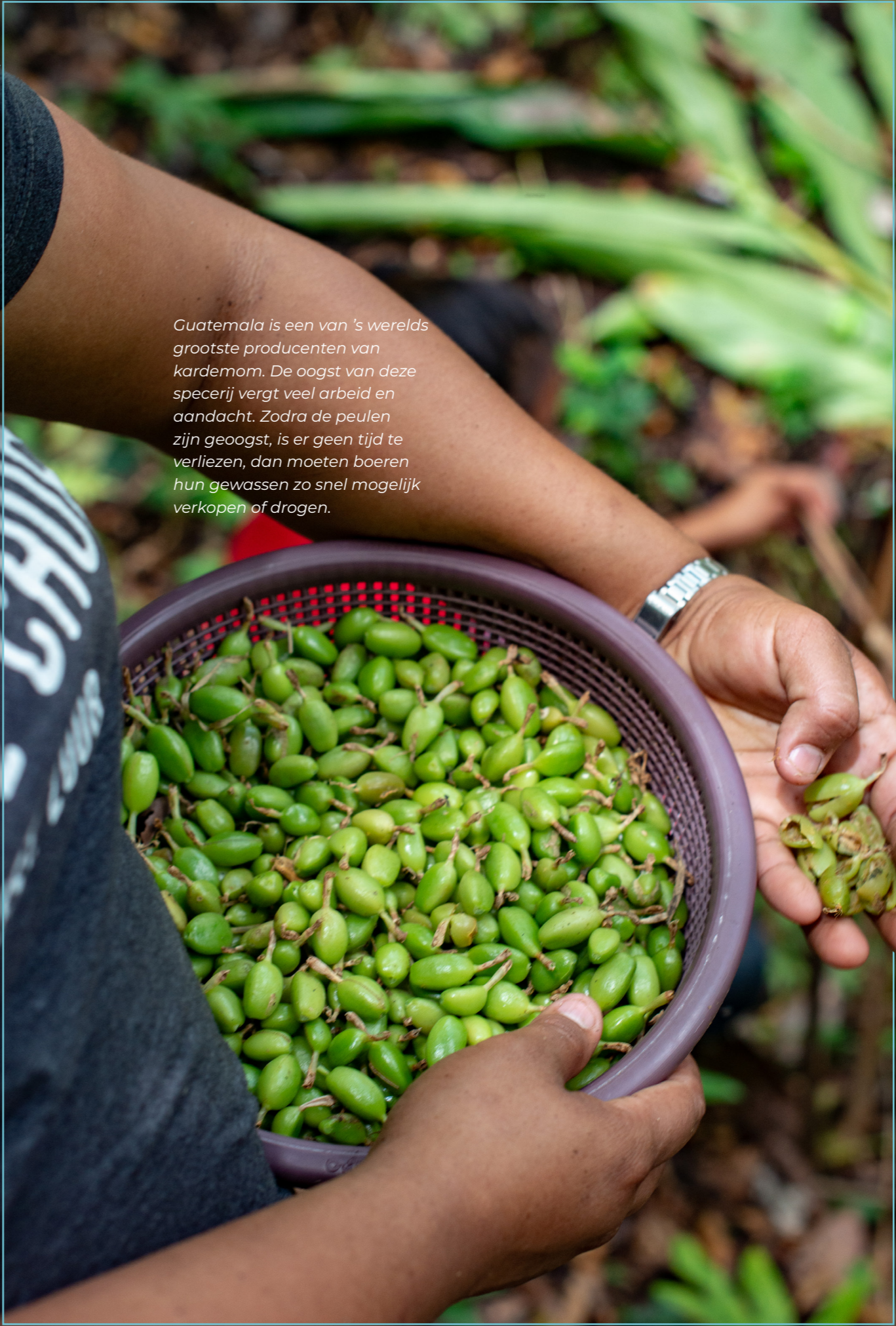
Guatemala is een van 's werelds grootste producenten van kardemom. De oogst van deze specerij vergt veel arbeid en aandacht. Zodra de peulen zijn geoogst, is er geen tijd te verliezen, dan moeten boeren hun gewassen zo snel mogelijk verkopen of drogen.