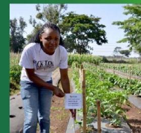
Rijk Zwaan, East-West Seed, Wageningen University & Research

In Tanzania werkte Rijk Zwaan samen met East West Seed, WUR en Ministerie van Buitenlandse Zaken aan het trainen van boeren in het project Seeds of Expertise for the Vegetable Sector in Africa (SEVIA). Met een holistische aanpak werden onder het motto 'Seeing is believing' tussen 2014 en 2020 ruim 48.000 boeren getraind.