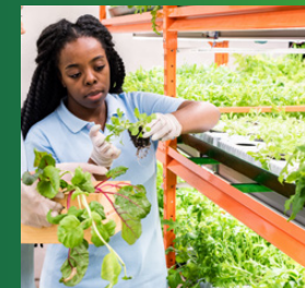
WAGENINGEN UNIVERSITY & RESEARCH

Wageningen University & Research leidt veel mensen op die na hun opleiding bijdragen aan een betere voedselzekerheid vanuit hun werk bij nationale en lokale overheden, boerenorganisaties bedrijven en (internationale) NGO's. Dat doen ze met de best beschikbare kennis, van projecten zoals FNS-REPRO waar met de FAO gewerkt is aan verbeterde voedselzekerheid in Soedan, Zuid-Soedan en Somalië.